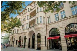
Business-Center im Haus Cumberland